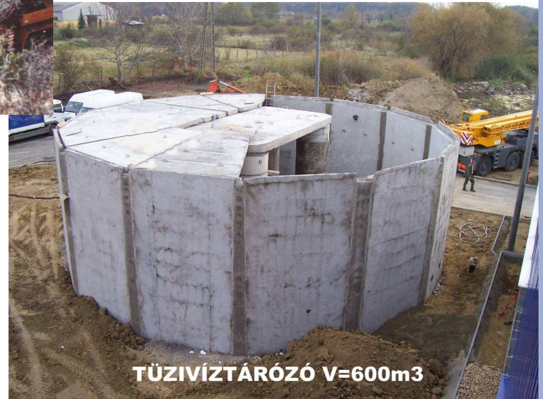
TÜZIVÍZTÁRÓZÓ V=600m 3